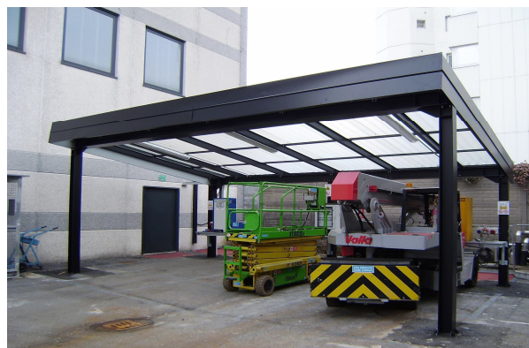
Copertura in policarbonato alveolare trasparente

Strutture e lamiere in acciaio FE360 B. Bulloni UNI 5737, dadi UNI 5586, rondelle UNI 6592