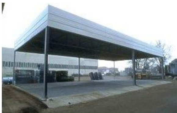
Copertura in lamiera zincata preverniciata.

Costituita da singola falda rialzata, eseguita con impiego di profilati commerciali, elementi in lamiera di acciaio e tubolare. Tutta la struttura è zincata a caldo a norme UNI 5744.