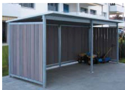
ECOBX con pareti in lamiera o in legno

Possibilità di fornitura in singolo modulo o in modulo bifacciale.