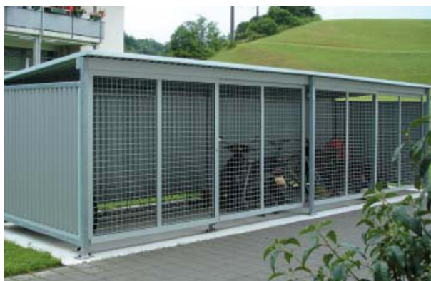
ECOBX con chiusura in grigliato